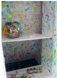
The Pearly Gates, 2012