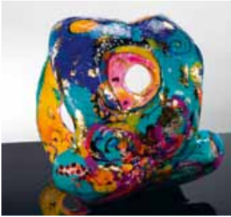
Butterfly Blossom, 2010