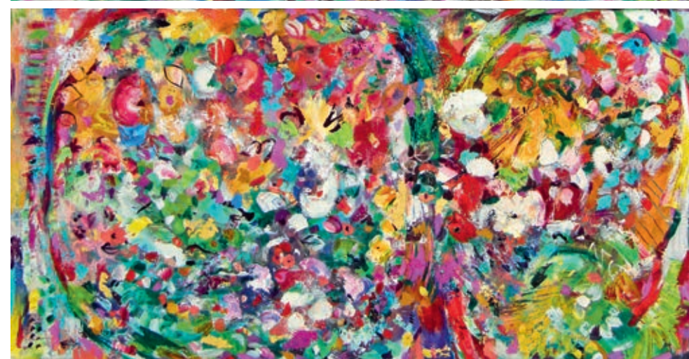
1000 Secrets Deep III & IV je 40 x 80 cm oder 80 x 40 cm