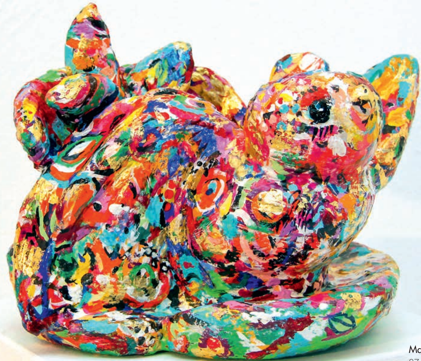
Magic Bird 27x35x36 cm