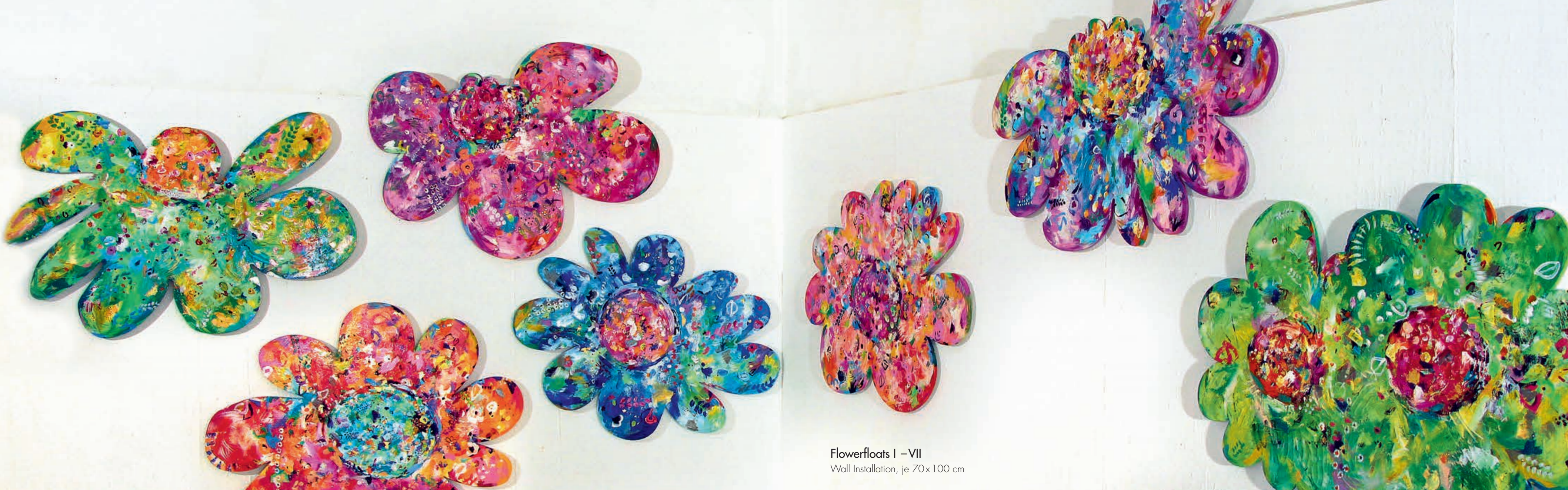
Flowerfloats I – VII Wall Installation, je 70x100 cm