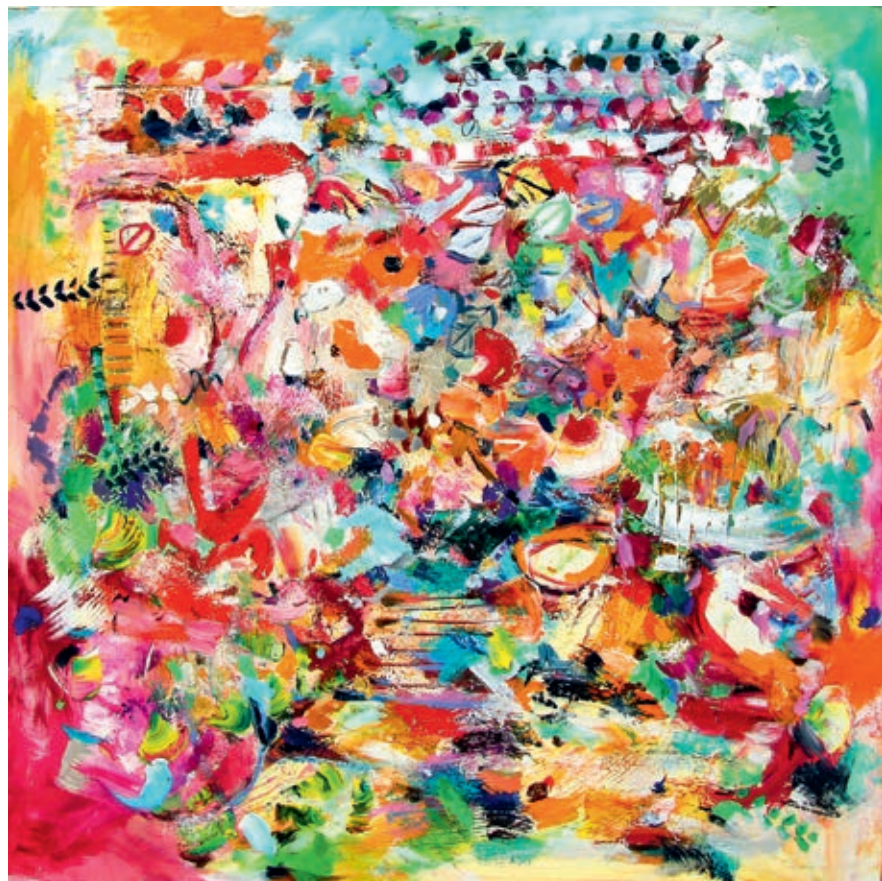
Birthday Park 70x70 cm