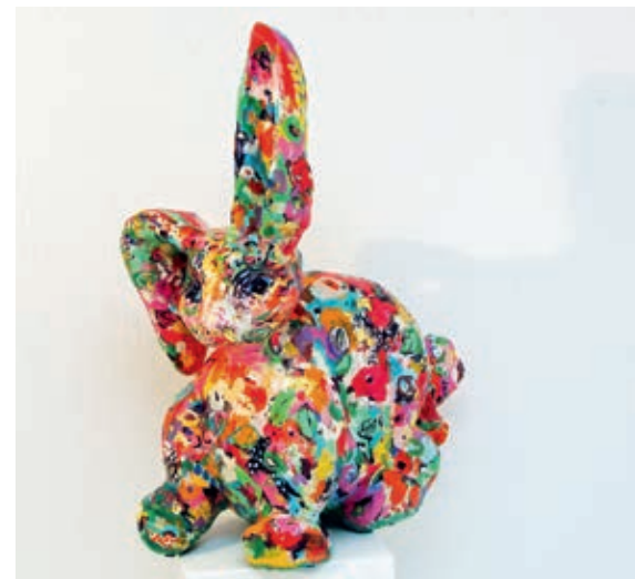
Rosy Rabbit Lovable 65x75x35 cm