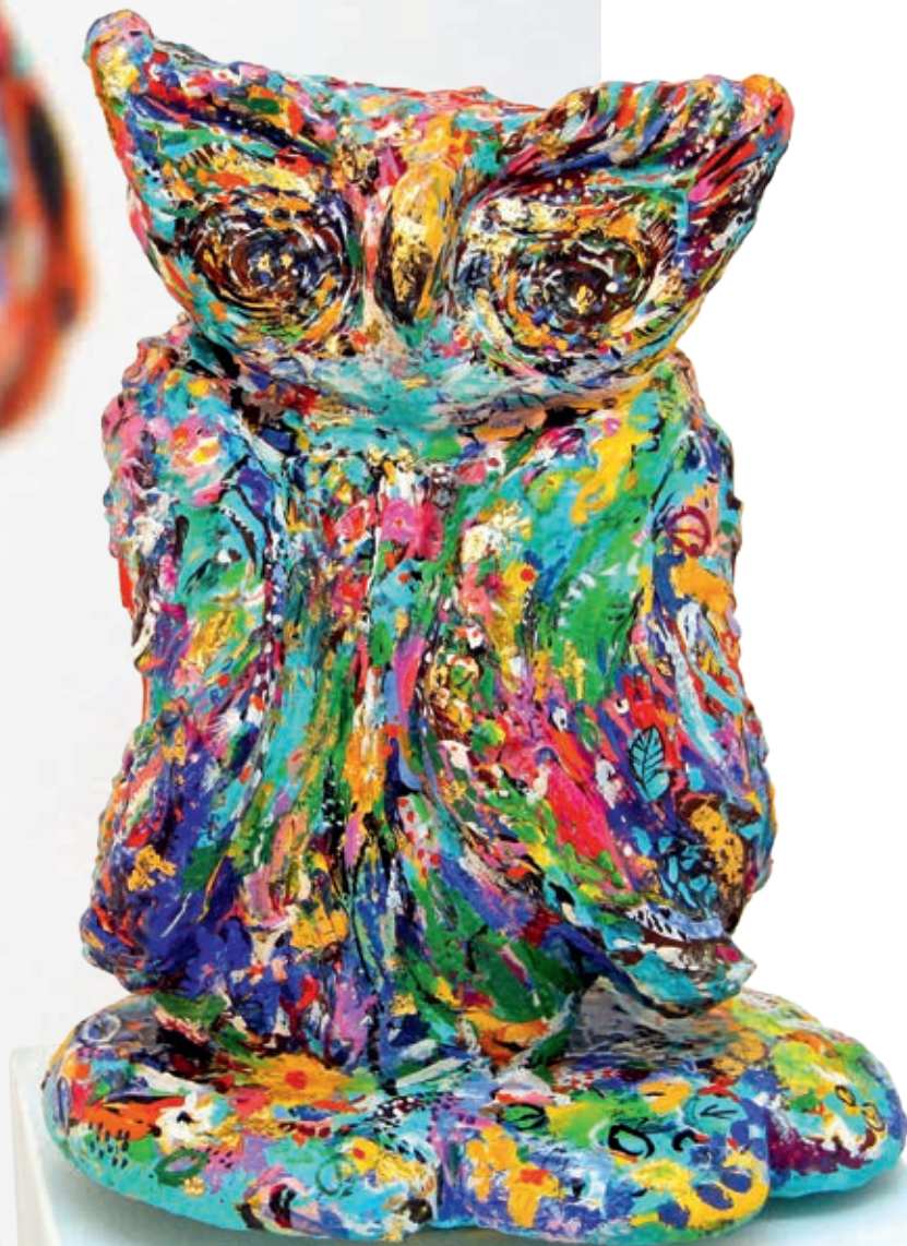
Owl, incognito 40x30x26 cm