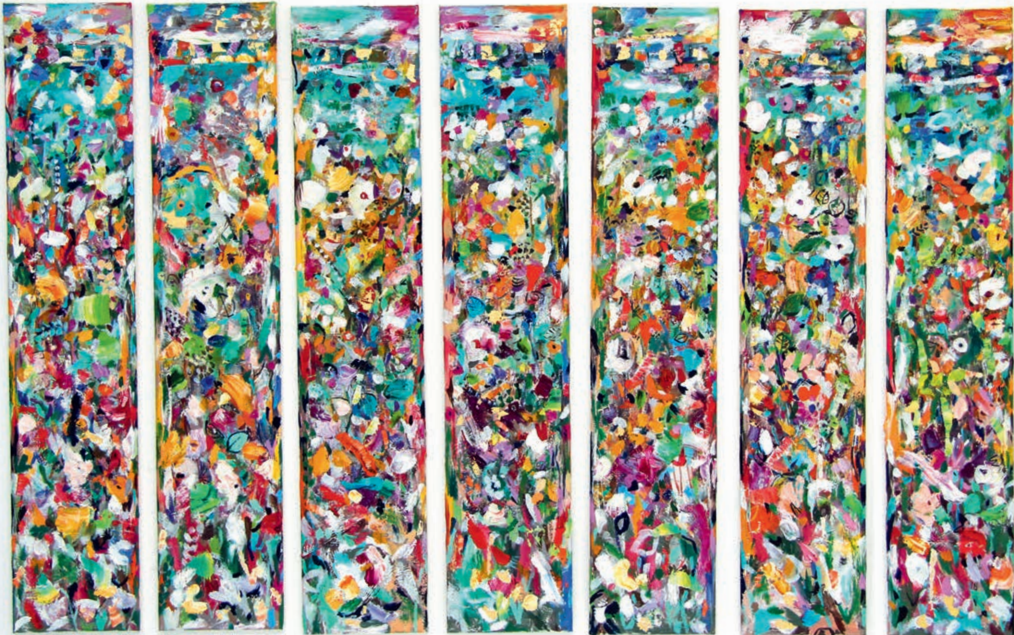
One Week, One Sun I-VII 100 x 160 cm