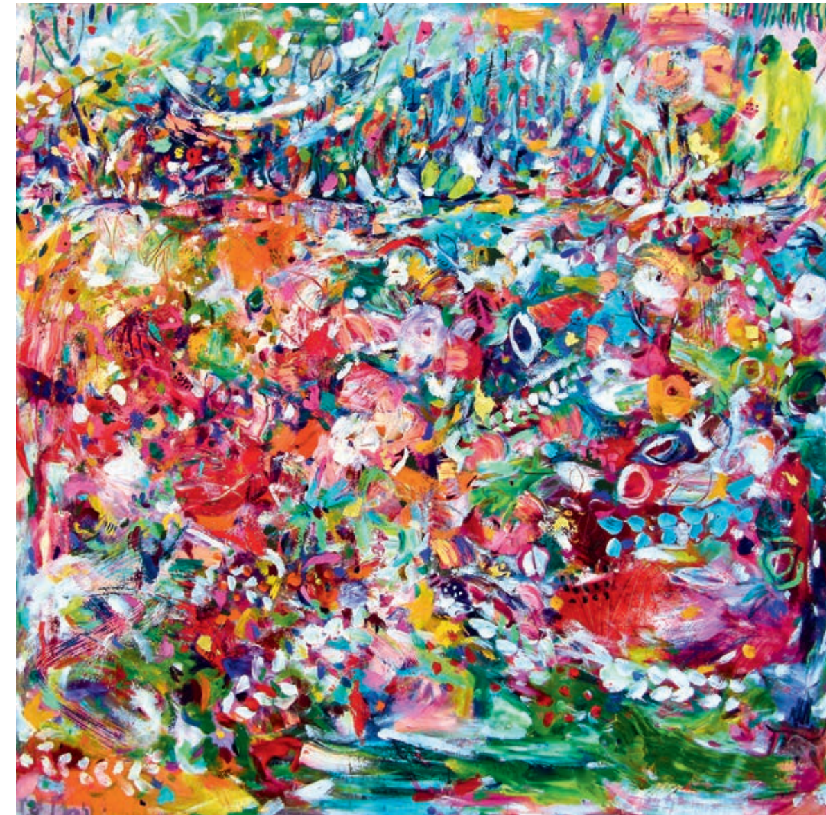
Invisible Lake 100 x 100 cm