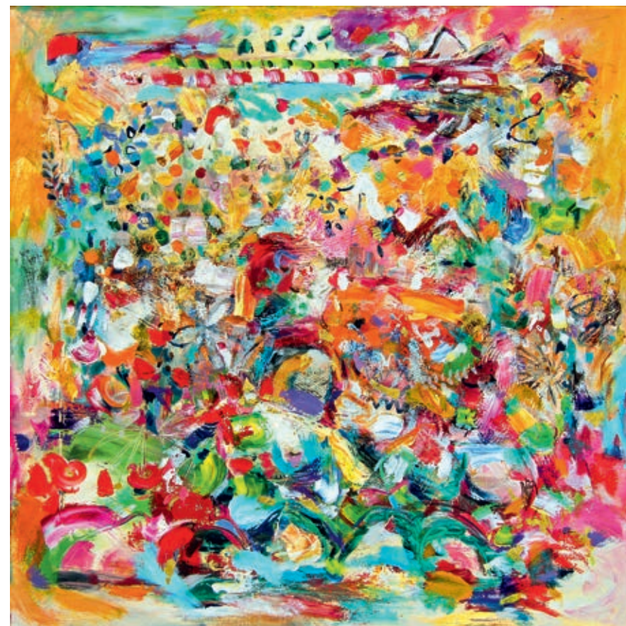
Park in the Mountains 70x70 cm