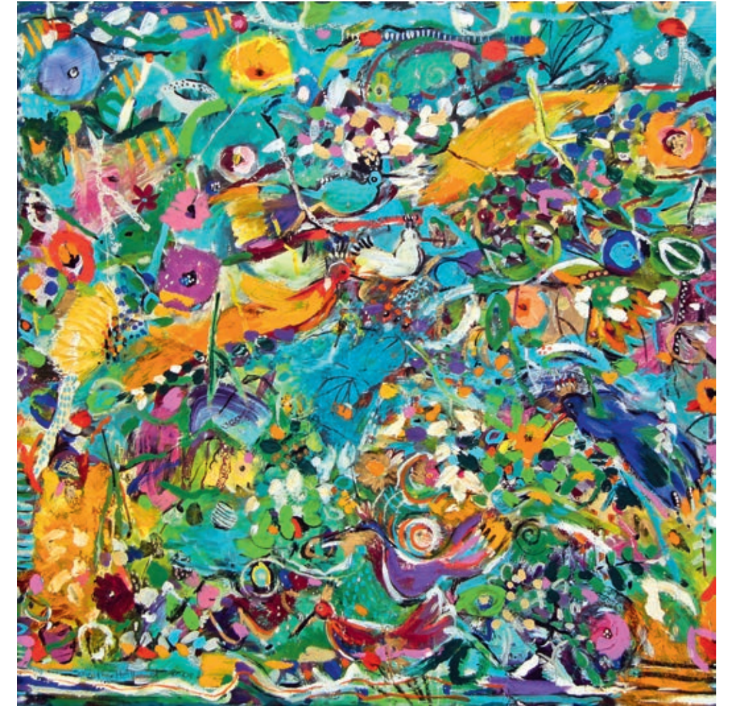
Blue Forest 100 x 100 cm