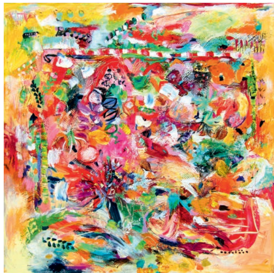
Park with Tree 70x70 cm