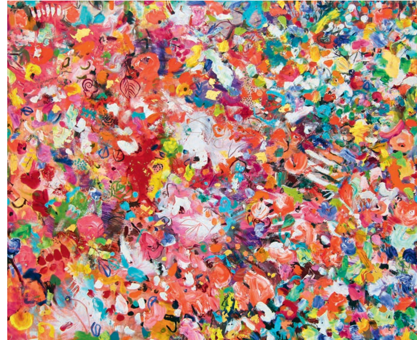
Passion and Flowers 100 x 120 cm