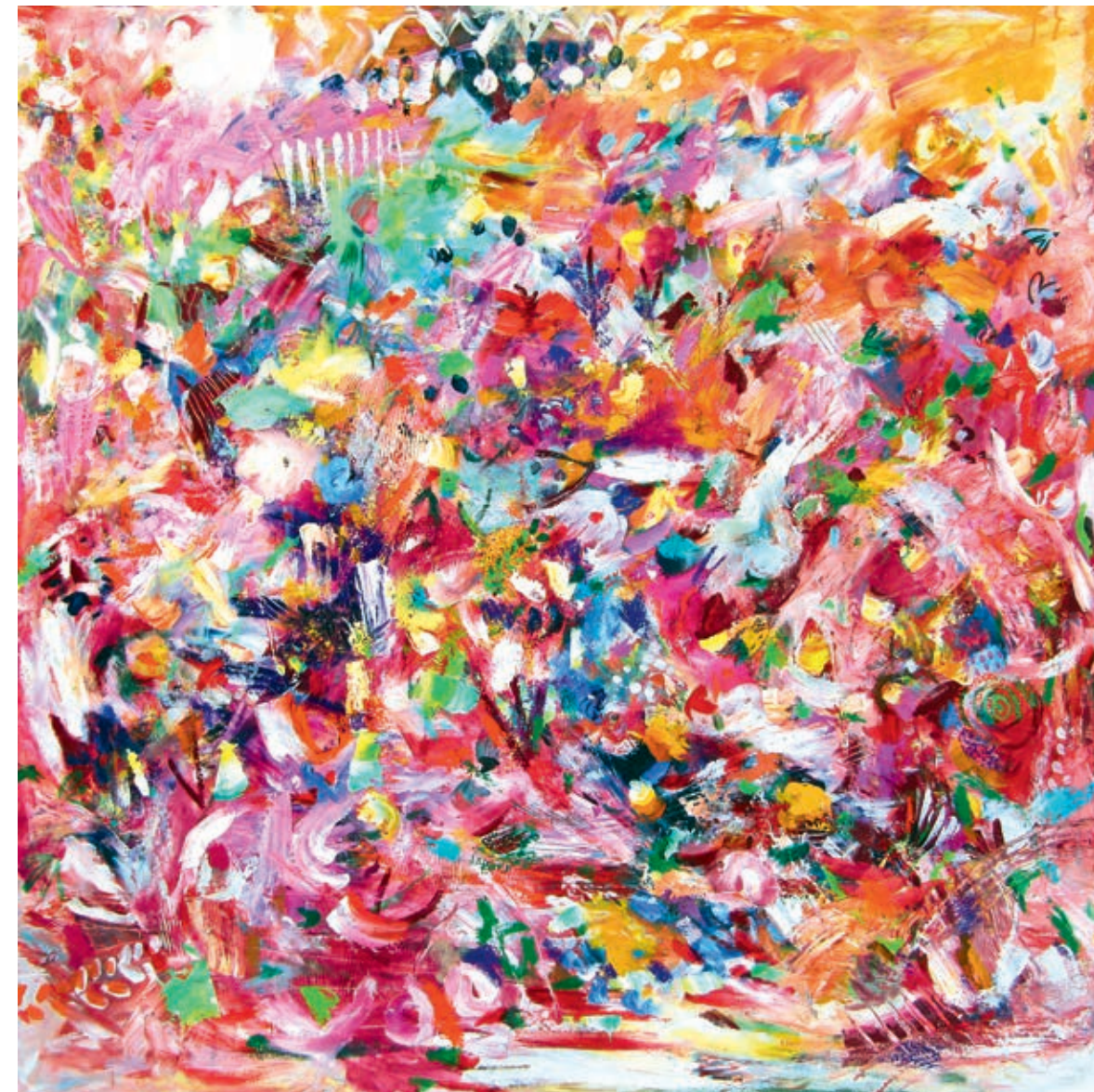
Red Magic Garden 100 x 100 cm