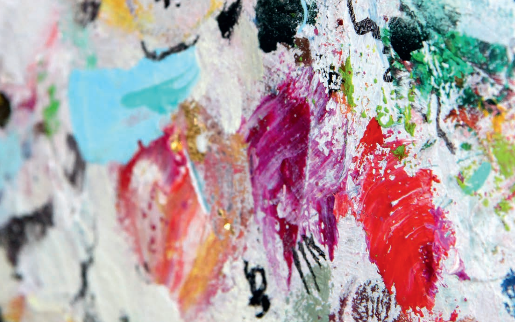
The Pinks of Gold I & II 160x200 cm