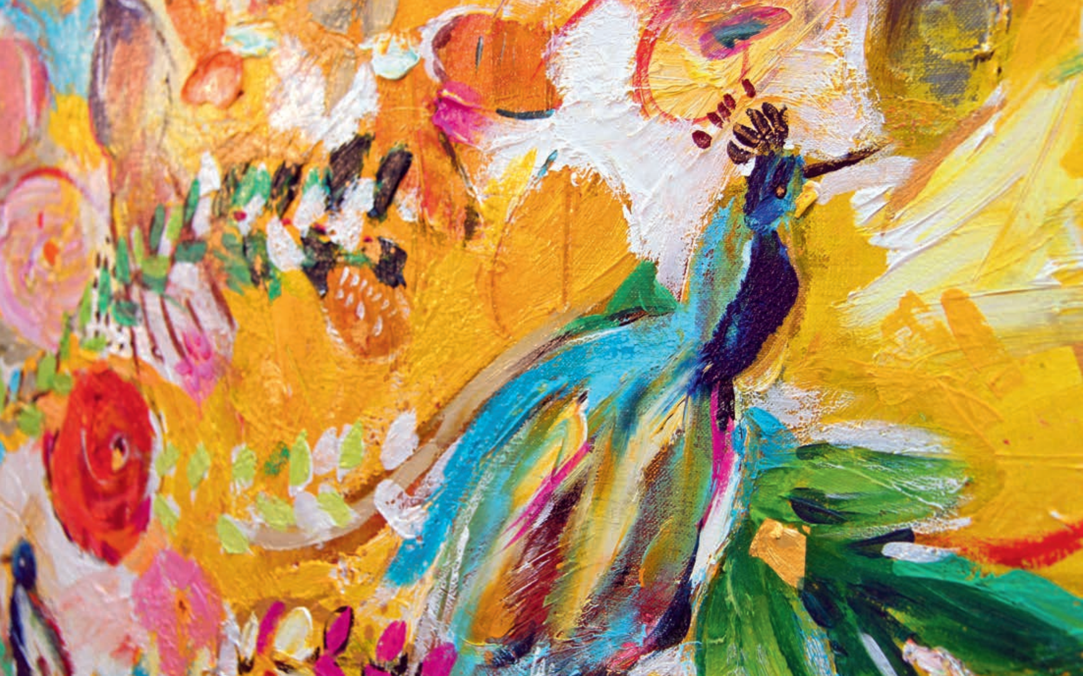
Welcome to Paradise I-III 154x222 cm