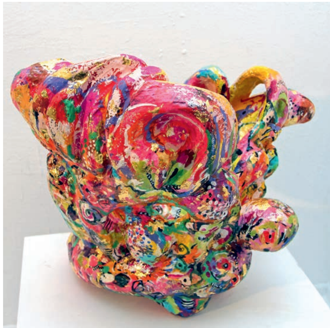
Dragon Princess 52x63x35 cm