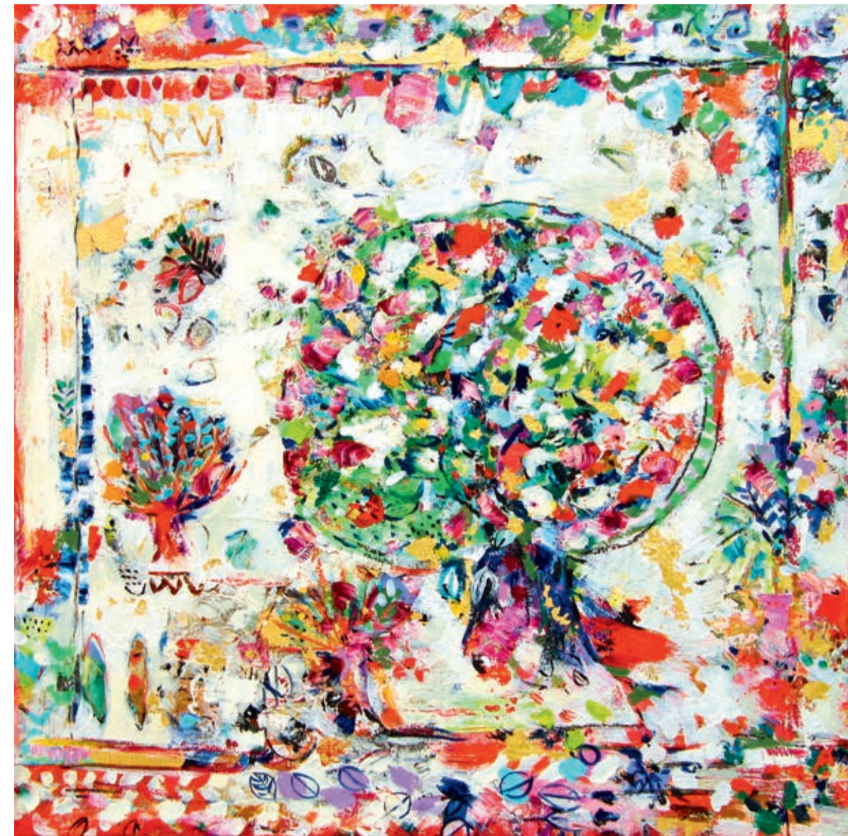
Royal Tree 60x60 cm