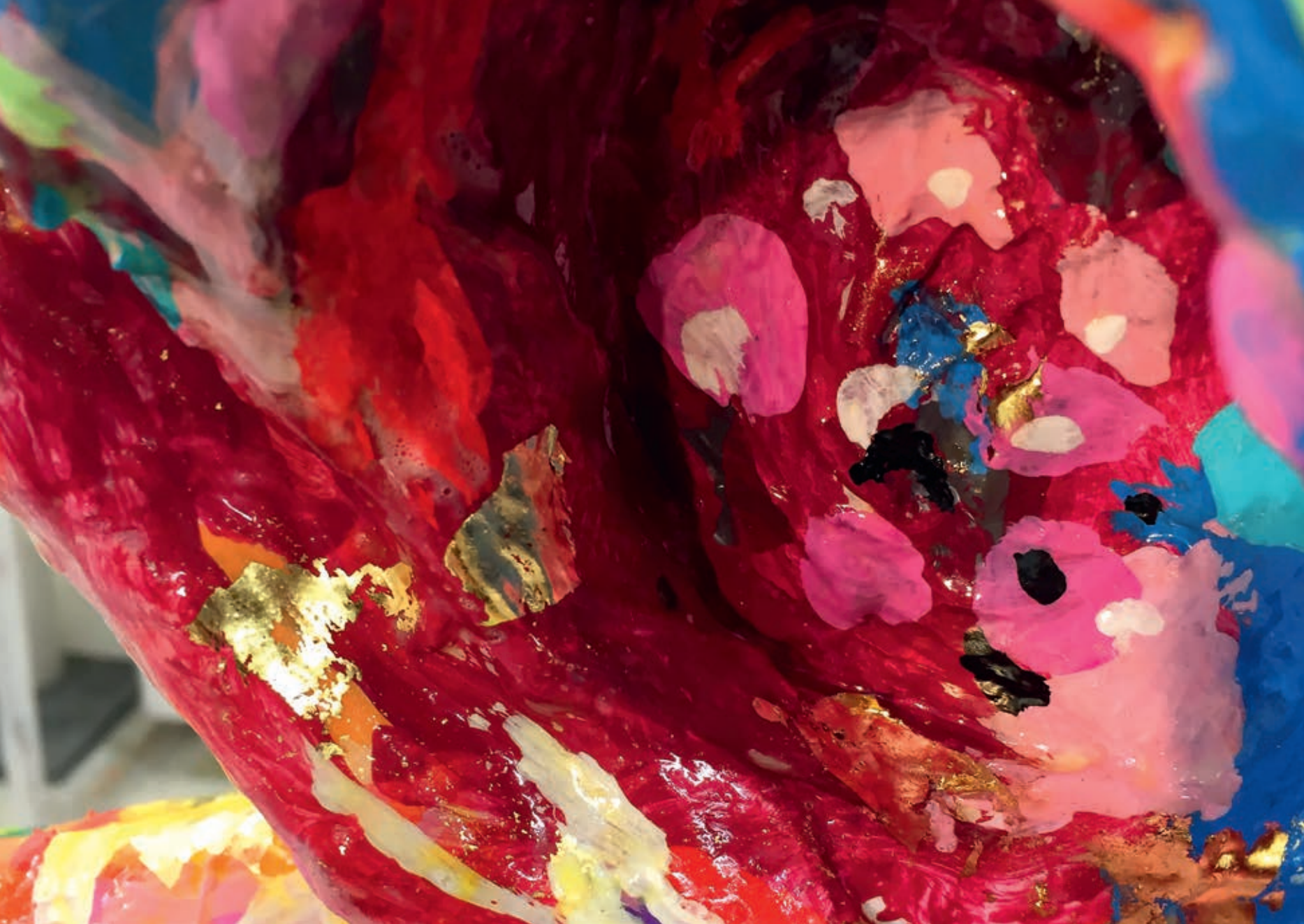
The Antedels ca. 27x 27x177 cm