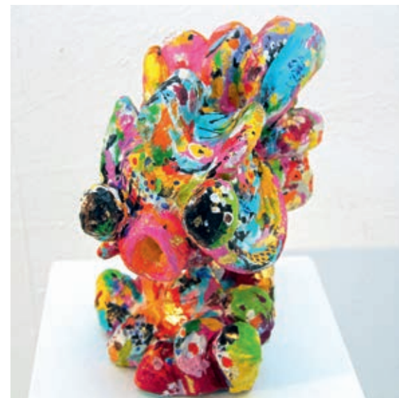
Tiny Bubble Fish 28x31x20 cm