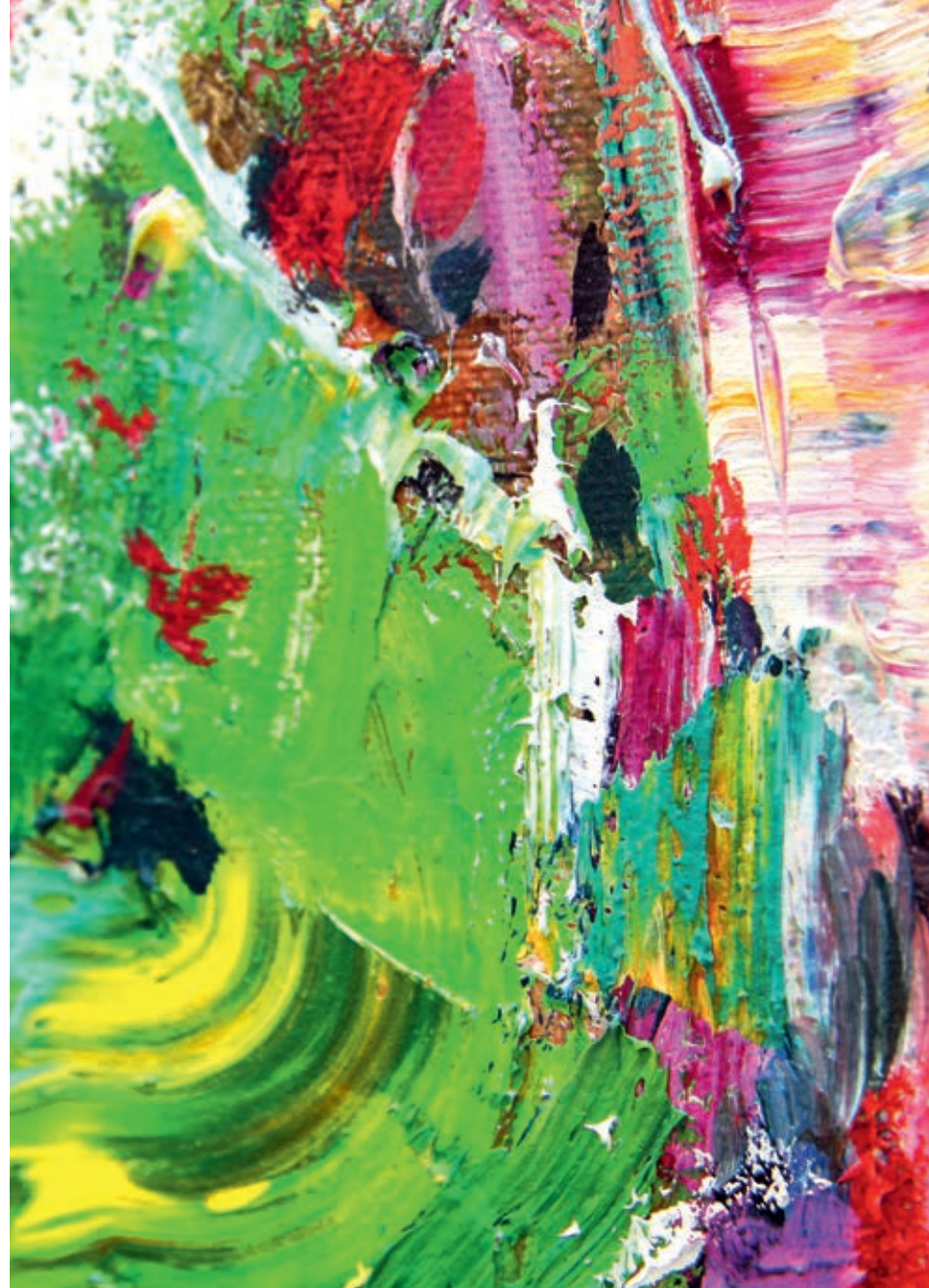
Treesdale 100 x 100 cm