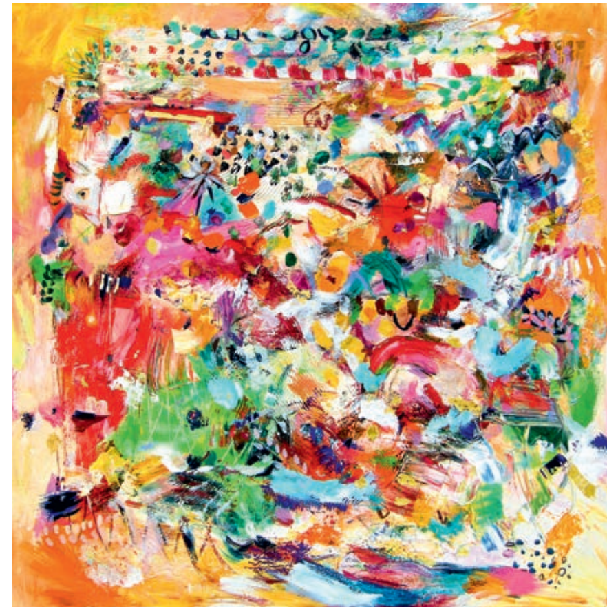
Indian Park 70x70 cm