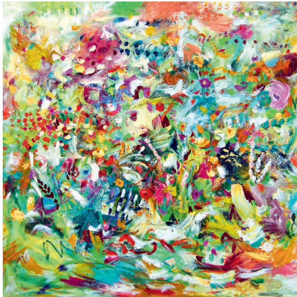
Green Magic Garden 100 x 100 cm