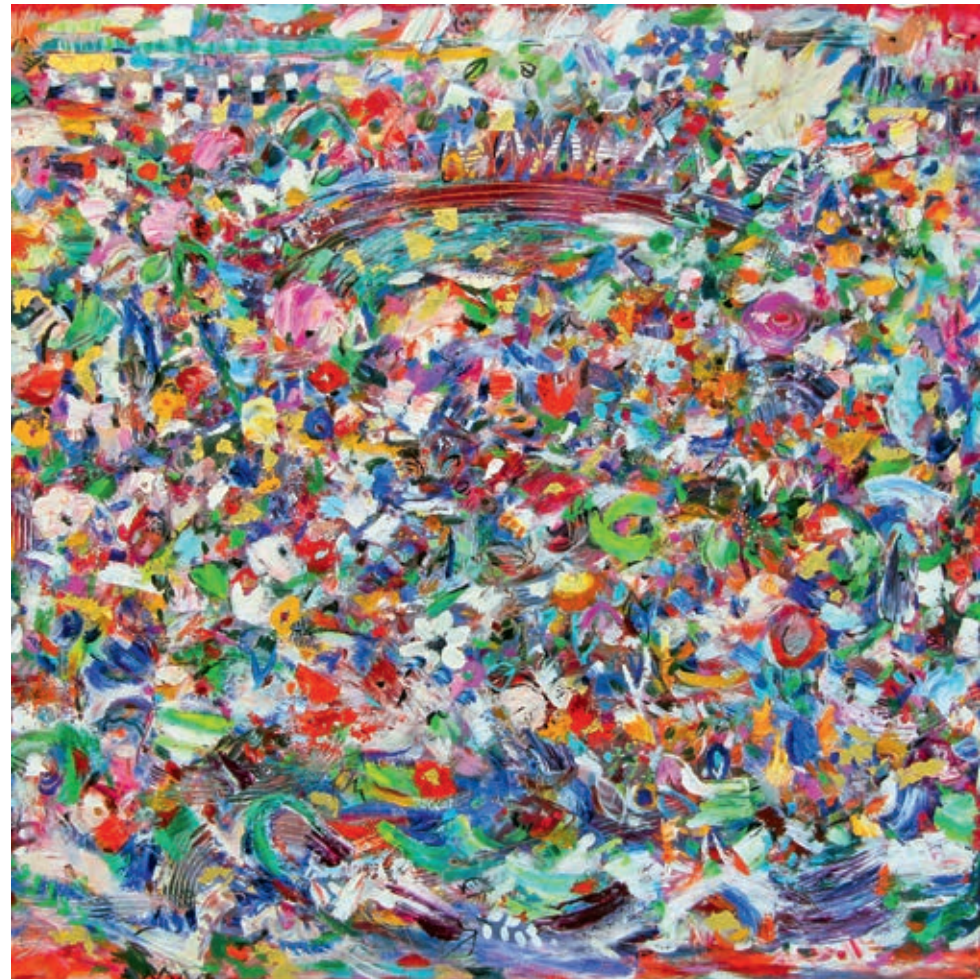
Rainbow of Night 100 x 100 cm