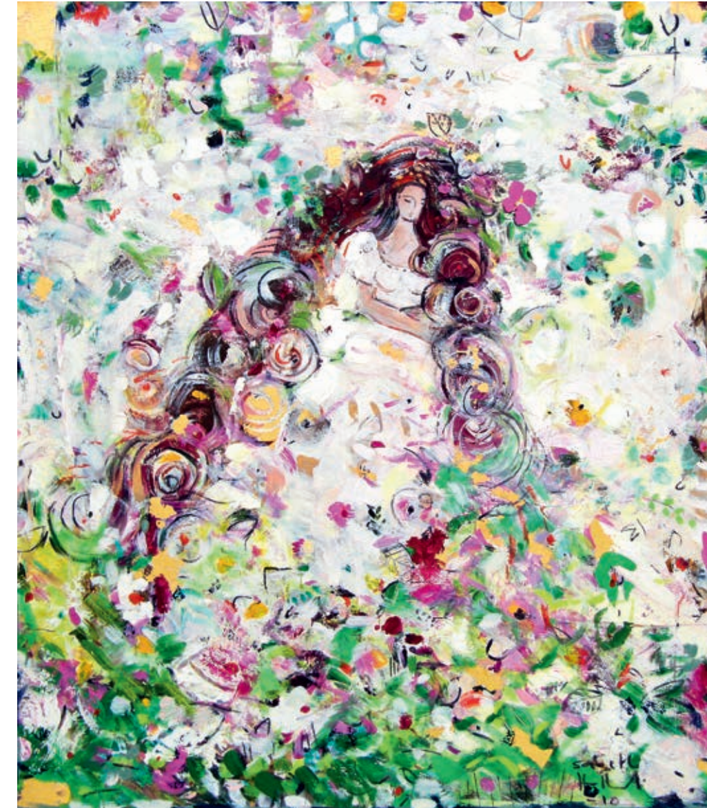
Walking in deep Thoughts 80 x 70 cm