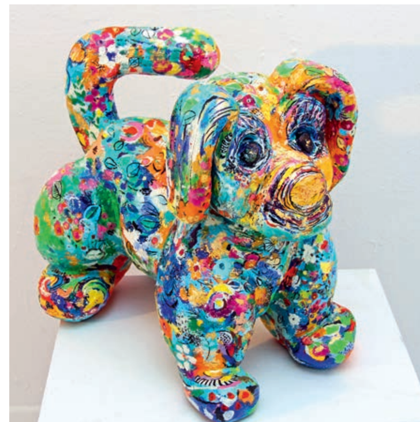
Alpha Dog Lovable 60x51x42 cm